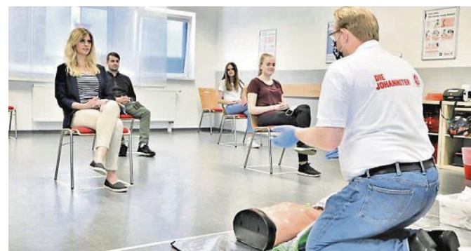
Die Johanniter führen wieder Erste-Hilfe-Kurse durch. Dabei gelten zum Schutz aller Teilnehmer besondere Hygienemaßnahmen.

Für Ersthelfer in Betrieben sind die zusätzlichen Lerninhalte von doppelter Bedeutung: Einerseits zur Eigensicherung, andererseits um auf Pandemie-Situationen vorbereitet zu sein. Die Unterweisung für Betriebshelfer umfasst den Umgang mit Schutzausrüstungen und dem hygienischen Handeln. „Wir wollen die Ersthelfer in