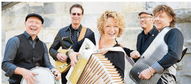
Gestalten die ersten Open Air-Veranstaltungen des PUC in 2020: Zydeco Annie + Swamp Cats (l.) und die Bluestrings.

Zydeco Annie + Swamp Cats Genießen Sie einen unvergesslichen Konzertabend mit dem neuen Programm: The Spirit of New Orleans. Verbringen Sie mit Zydeco Annie + Swamp Cats einen unvergesslichen Abend in dieser Stadt. Lassen Sie sich anstecken von Begeisterung und Lebensfreude, ergeben Sie sich der Hitze und dem Verlangen nach Mehr, wecken Sie die Sehnsucht nach Weite und Freiheit und nehmen Sie ein Stück davon mit nach Hause, ganz im Sinne des „Spirit of New Orleans“. So vielfältig wie in New Orleans die Geschichten, so vielseitig die Band Zydeco Annie + Swamp Cats. Sie verstehen es, in ihrer Einzigartigkeit die ei-