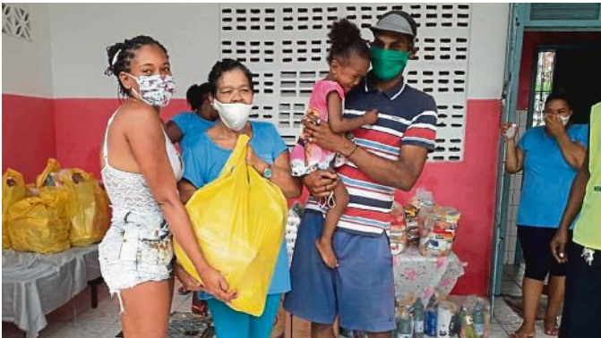
Das Foto stammt aus Novos Alagados und zeigt die Verteilung der Hilfspakete.