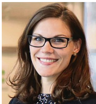
Umwelt: Anja Arnold